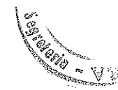
TABELLA E) - Allegato alla D.C.C. n. _____ del _____