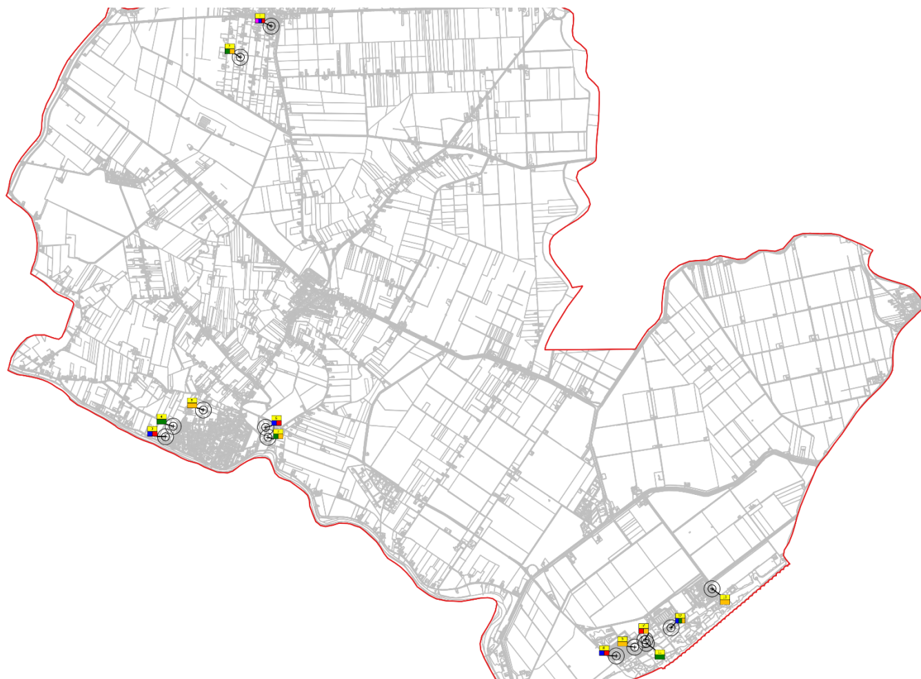
Estratto Tavola Catasto Siti